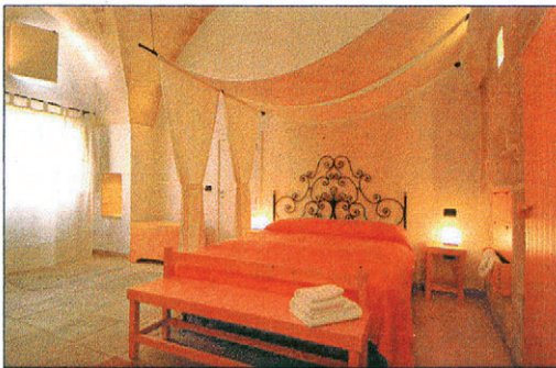
Einrichtung eines Zimmers im Corte dei Francesi (siehe S. 177)