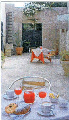
Das Frühstück ist in Apulien zwar schlicht, aber lecker