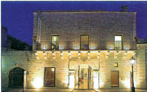
Palais des 15. Jahrhunderts: Corte dei Francesi in Maglie (siehe S. 177)