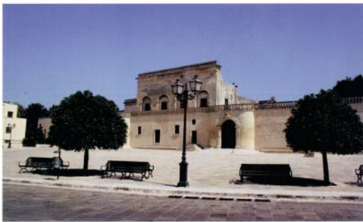
SILENZIO, SI GIRA! Il palazzo marchesale di Botrugno, comunemente indicato come palazzo Guarini, con cornicioni, balaustre e cornici delle finestre di pietra leccese. Sotto, una strada del centro di Maglie.