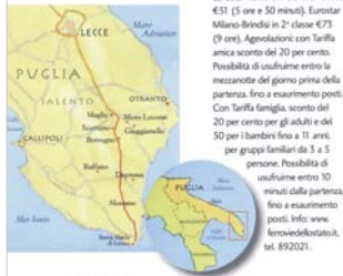
ER | GentaViaggi

*F* Le Pezzate Sei camere e una bella piscina, in masseria. Ammessi i cani. Cane su prenotazione (€25-30); tra le specialità, cioci e vino, ovvero pasta e ceci, e le pitole, pasta di pane con capperi, peperoncino e pomodoro. E ancora, melanzane a bianchetta e crostate con le loro marmellate di fichi e fichi d'India. Telefono: 368.3739533. Prezzi: €45-55 a persona, inclusa la prima colazione con ciambelloni e ottime corlette fatte in casa. ★★☆☆☆