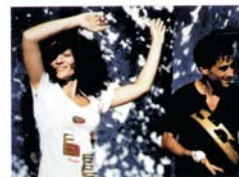
NUOVO CINEMA ITALIANO Un fotogramma di Sangue vivo, il primo successo di pubblico tra i film di Edoardo Winspeare.

www.pugliaturismo.it it.turpicca/ Ufficio di promozione turistica di Lecce www.coppellata.it Associazione onlus di cui fa parte Edoardo Winspeare www.lacultura.it Il giardino di piante grasse unico in Italia