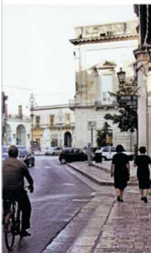
128 | GenteViaggi